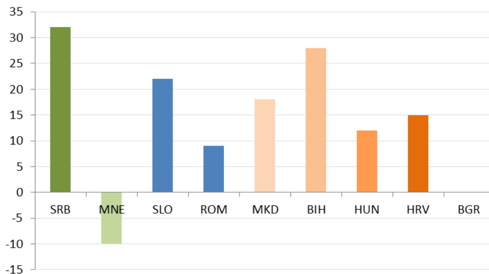
Grafik 2. Promena u rang u zemalja u regionu između 2015. i 2016. godine

Od zemalja u okruženju, prema Izveštaju za 2016. godinu, skoro sve zemlje su veoma napredovale, a najviše Srbija, koja se pomerila za 32 mesta — sa 91. na 59. mesto, zatim Bosna i Hercegovina, koja je napredovala za 28 mesta (sa 107. na 79), Slovenija je napredovala za 22 mesta (sa 51. na 29), Makedonija za 18 mesta (sa 30. na 12), Hrvatska za 15 mesta (sa 65. na 40), Mađarska za 12 mesta (sa 54. na 42), a Rumunija za 9 mesta (sa 48. na 37), dok je Bugarska zadržala isti položaj kao i prethodne godine na konačnoj listi zemalja prema lakoći poslovanja. Crna Gora je jedina zemlja u regionu koja je od prethodnog izveštaja nazadovala za deset mesta (sa 36. na 46. mesto).